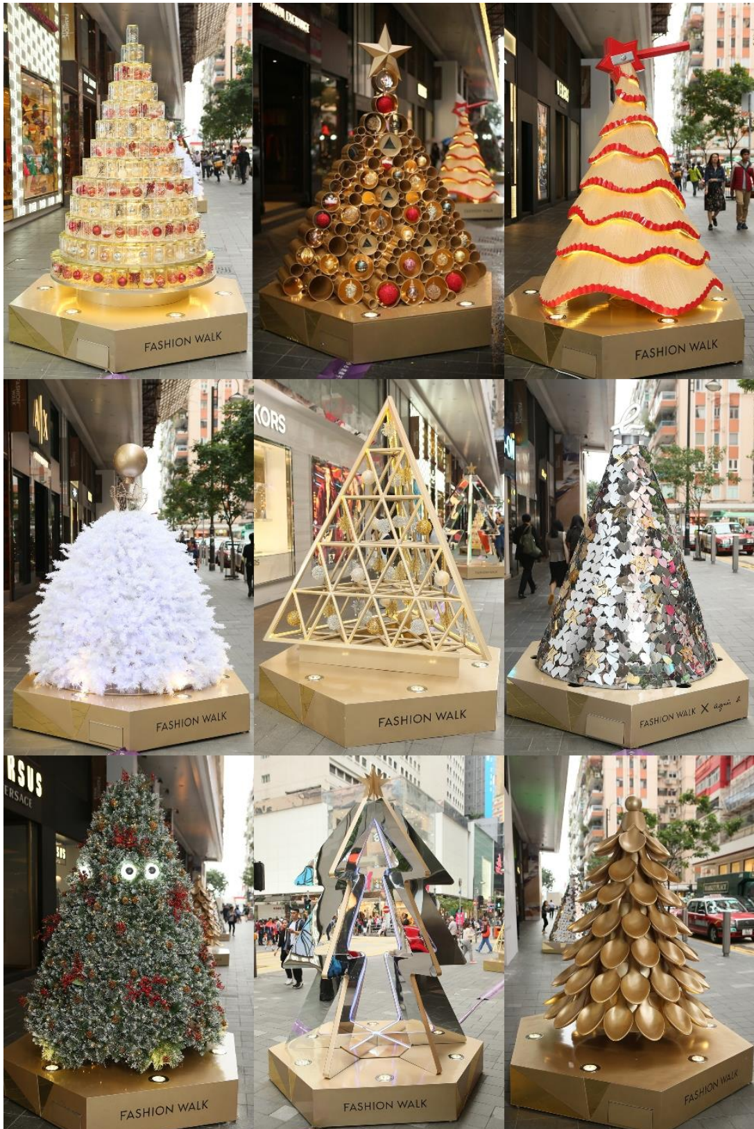
Fashion Walk 百德新街以重疊藝術、呈獻別具玩味的聖誕樹巡禮，散播節日氣氛。