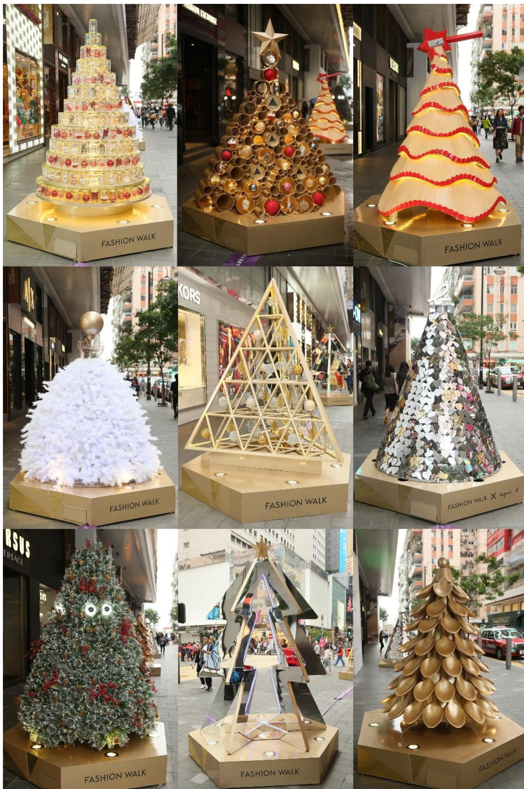
Fashion Walk 百德新街以重叠艺术、呈献别具玩味的圣诞树巡礼，散播节日气氛。