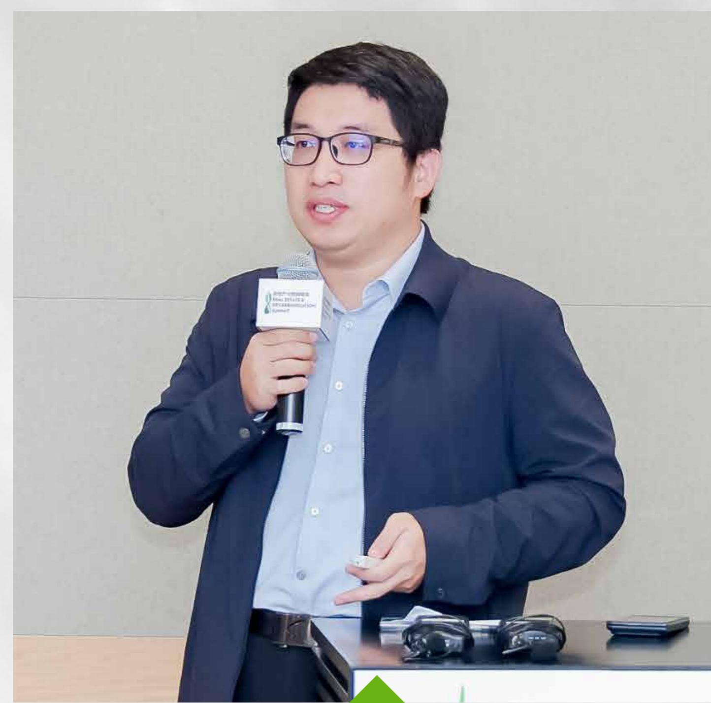
曹植- 南开大学环境科学与工程学院 教授