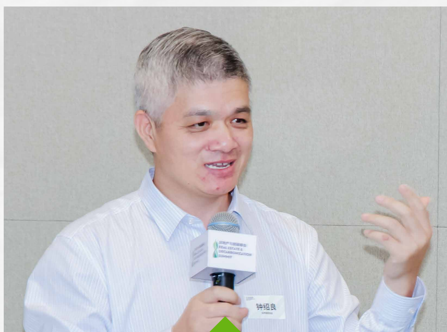
钟绍良- 世界钢铁协会副总干事兼 北京代表处首席代表