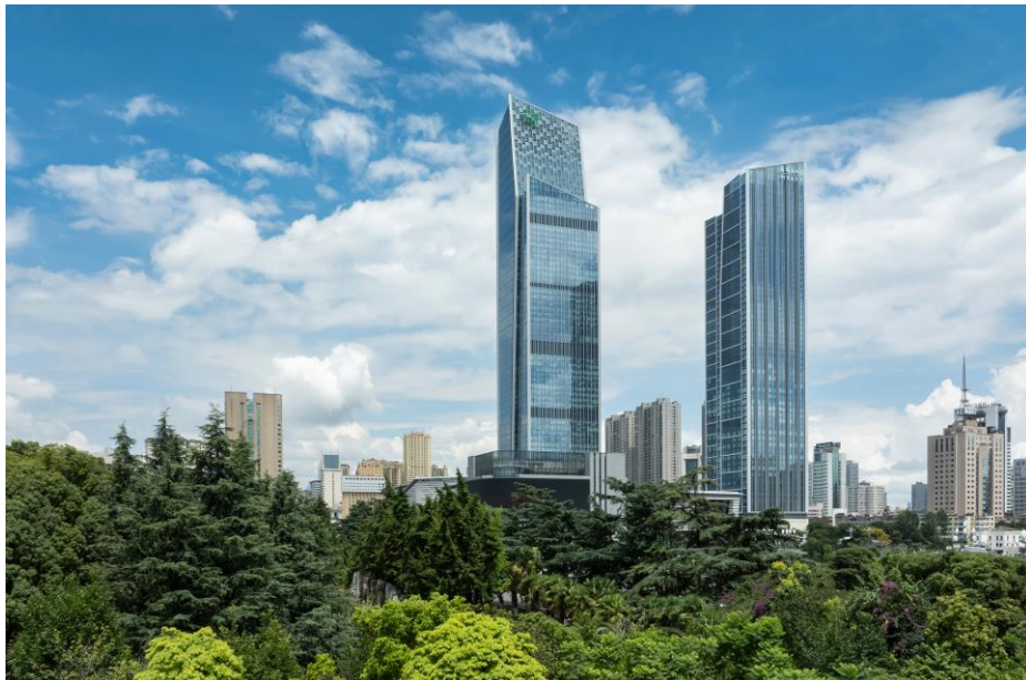
昆明君悅酒店與昆明恒隆廣場無縫銜接，將為當地的旅遊、生活和商務環境注入全新活力