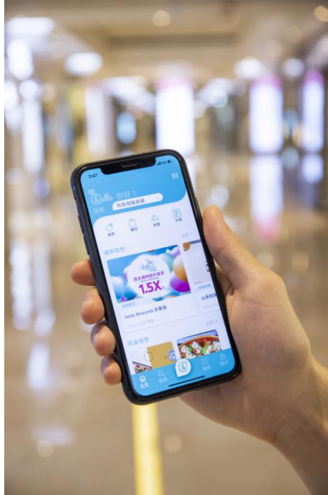
圖片說明 4: hello 會員每消費 HK$1 可賺取 1 hello 積分，兌換多個專屬體驗。