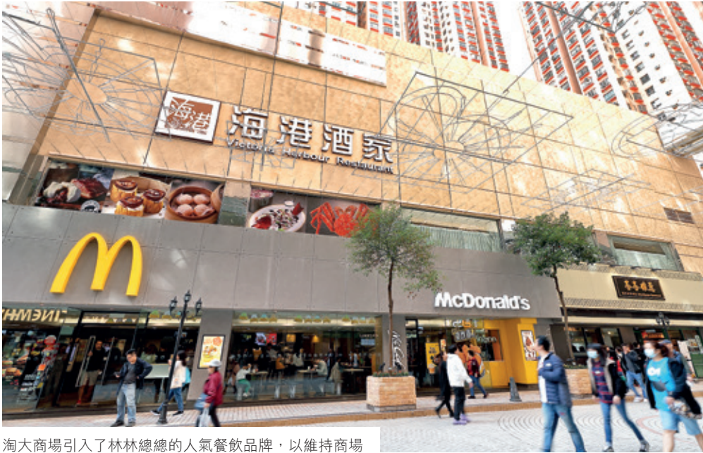
淘大商場引入了林林總總的人氣餐飲品牌，以維持商場對附近居民的吸引力

鑒於醫療服務業在經濟衰退下表現強韌，我們已採取多項措施包括翻新雅蘭中心其中兩層以從此行業吸納新租戶。2021年，我們將鎖定其他業務有較高可持續能力的行業，以開發新客源。