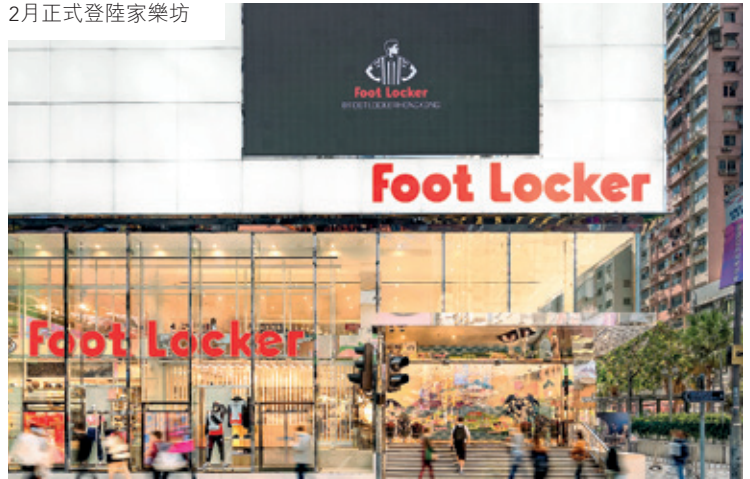
Foot Locker Power Store 旗艦店於2021年2月正式登陸家樂坊