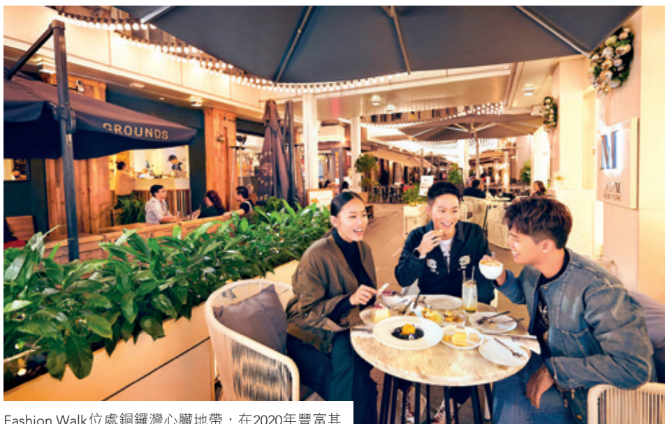
Fashion Walk 位處銅鑼灣心臟地帶，在2020年豐富其時裝零售、餐飲及娛樂陣容

店進駐，鞏固商場的美容品牌陣容。DURAS、DELStore、kapok、OKURA 和 Sweaty Betty 亦強勢加盟獨家時裝及時尚生活品牌行列。Fashion Walk 亦吸納了多家餐飲店進駐，包括牧羊少年咖啡館、Urban Coffee Roaster、Moo Moo Plus、日本清酒藏所 SAKE SAN 和日式甜點品牌 Pancake 專門紗織，提供更多元化的美食選擇。由於疫情嚴重打擊消費