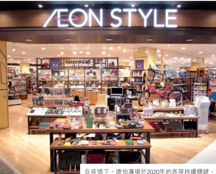
在疫情下，康怡廣場於2020年的表現持續穩健，反映其強韌實力