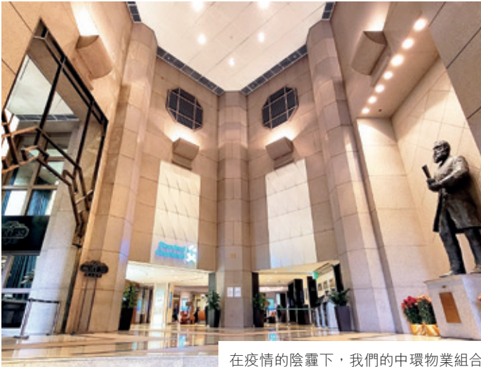
在疫情的陰霾下，我們的中環物業組合在2020年的租賃表現依然穩健

和客流量，截至2020年底，Fashion Walk的租出率下跌四個百分點至93%。未來，全新會員計劃將於2021年第一季度推出，屆時將有助吸引顧客並支援租戶業務發展。